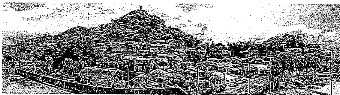
圖 3 蟾蜍山聚落眺望，前方馬路即為羅斯福路 119 巷，路邊停車旁為居民最常使用的廣場 (2)