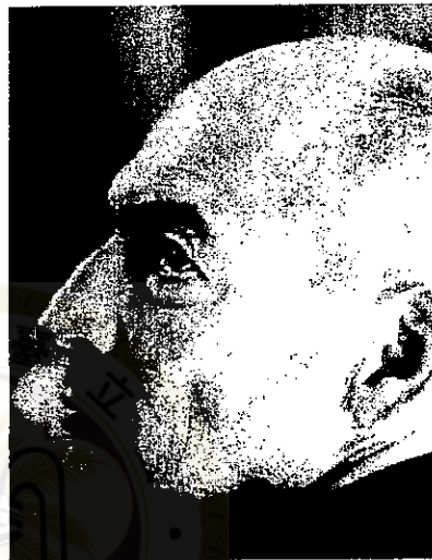
庫哈斯是 21 世紀最受爭議的建築師，但也有許多人拿他跟柯比意相

2002年，庫哈斯贏得北京中央電視台（簡稱 CCTV）的設計權，卻引來各界撻伐。在西方，建築界批評他甘為中國官方媒體設計深具權力象徵的摩天大樓；在中國，CCTV 從選址、外型到造價、結構安全都飽受質疑。庫哈斯接受大陸媒體訪問時卻表示，建築需要爭議，「只有令人厭煩的建築，才只有一種聲音」。