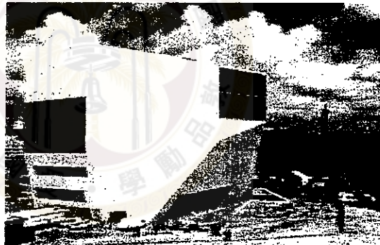
庫哈斯設計的葡萄牙波爾多音樂廳，打破傳統音樂廳的封閉性，讓原本供精英享用的音樂廳變成露天市民廣場。

波爾多音樂廳便是這樣的例子。這個音樂廳位於葡萄牙勞工住宅區邊緣，工人與音樂廳的高雅形象乍看格格不入，庫哈斯卻讓音樂廳變身市民廣場，令藍領居民也樂於親近。這個案子被認為是庫哈斯迄今最成功的作品，雖然它不規則狀的外型實在難以讓人恭維。