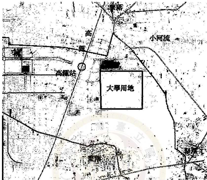
圖 1 現況圖