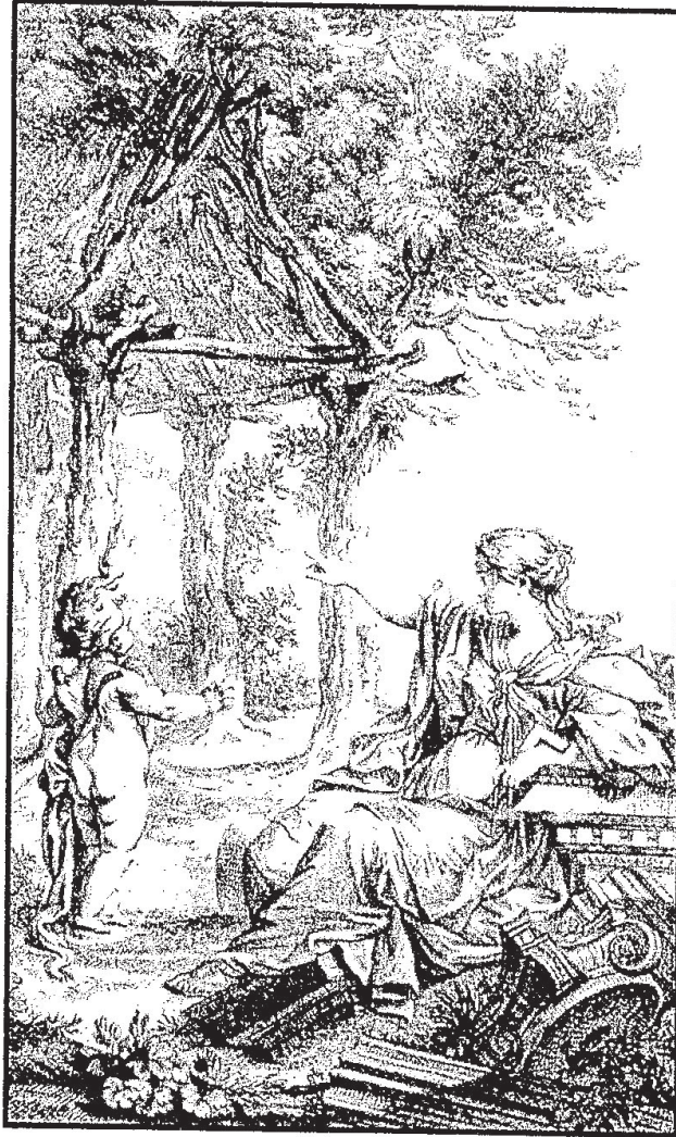
勞吉爾 (Laugier) 所繪的「始原的小屋 (The Primitive Hut)」

請你作答：敘述這張棟建築素描，其所表現之建築基本要素 (element) 的構成與其意義。