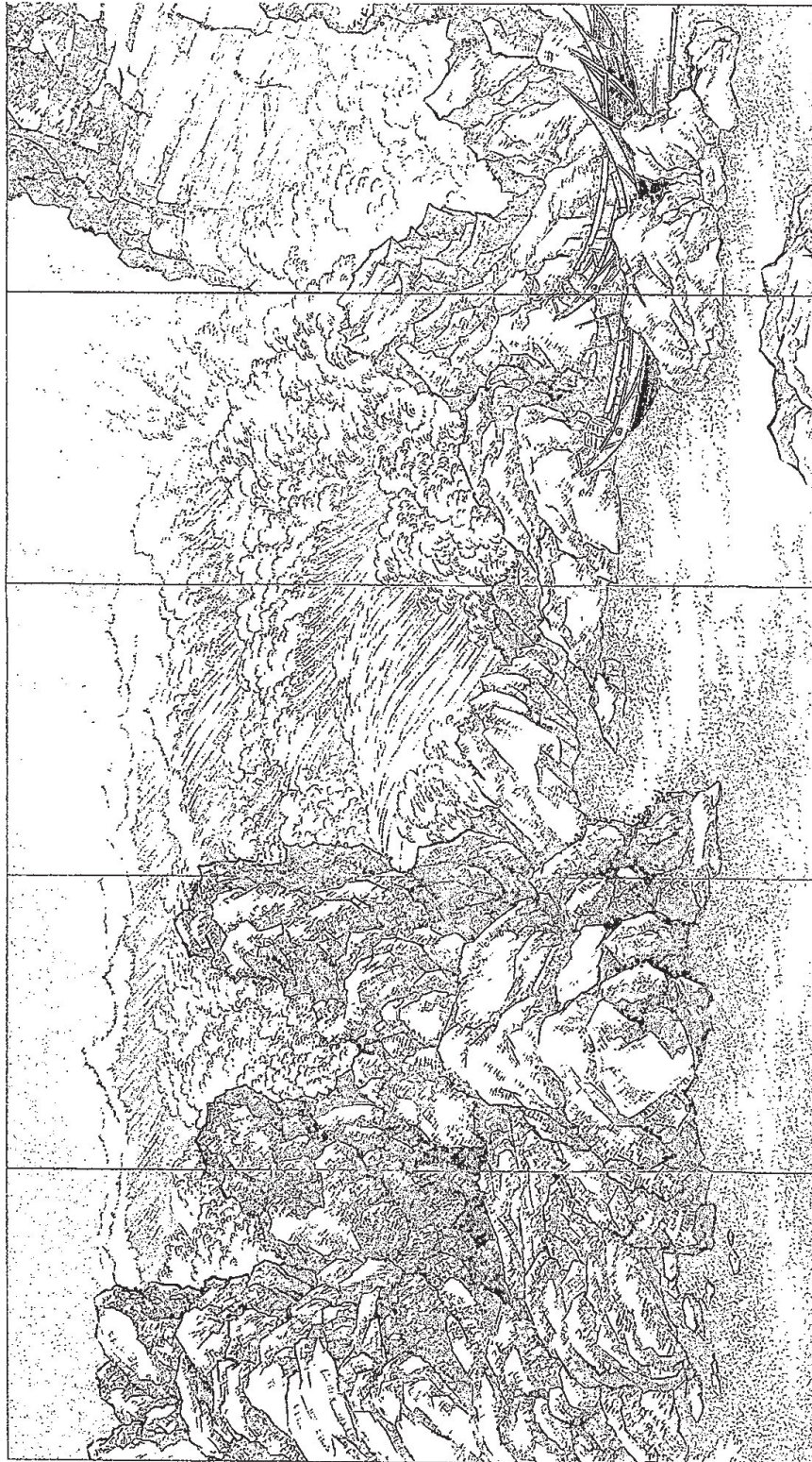
鄉原古統，《臺灣山海屏風——北關怒潮》（局部），1931年，台北市立美術館藏

三、下圖是鄉原古統所繪《臺灣山海屏風——北關怒潮》的局部，請就此局部圖片，分析其風格、主題和畫面表現。